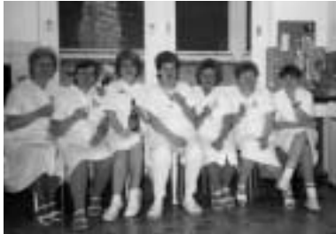
◀ Geschichten um den Birkenhof Seite 6