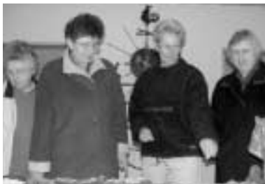
◀ Basar des Elternvereins für einen guten Zweck Seite 14