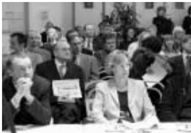
◀ 7. Sendenhorster Advents-Symposium Seite 14