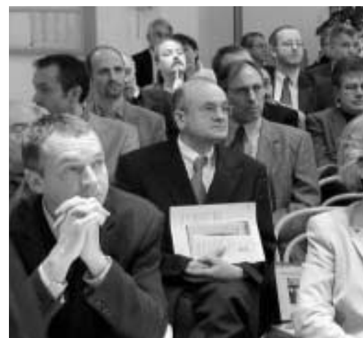
Zahlreiche Mediziner hatten sich zum 7. Sendenhorster Advents-Symposium eingefunden.