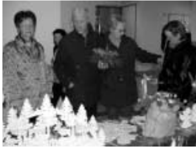
Gut besucht war wieder der Basar des Elternvereins rheumakranker Kinder.

D er Duft von Glühwein durchzog das Foyer, und die im Eingangsbereich aufgebaute Dekoration gab einen ersten Eindruck vom vielfältigen Angebot: Der Basar des Elternvereins rheumakranker Kinder, der