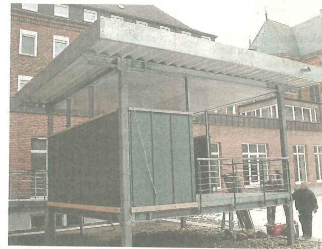
Ein neues Domizil für die Raucher. Der Boden ist mit einer Heizung versehen.

Intensivstation direkt neben dem OP-Bereich ist aber nur ein Teil der Großbaustelle.