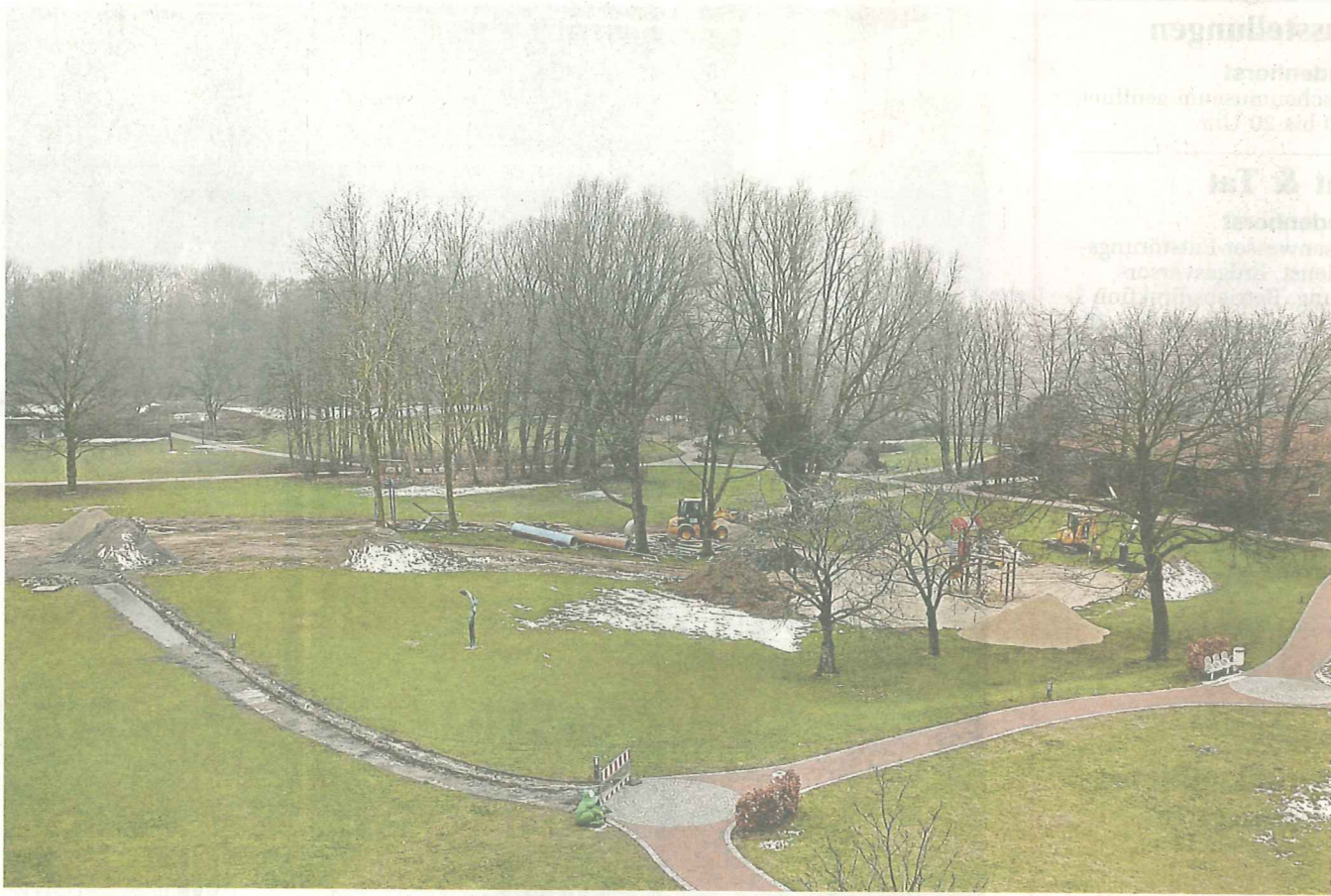
Der Blick in den Park, der derzeit von Grund auf umgekrempelt wird. Derzeit wird auch der Spielplatz für die Polarstation neu angelegt.

Am und im St.-Josef-Stift wird an vielen Stellen gleichzeitig gebaut