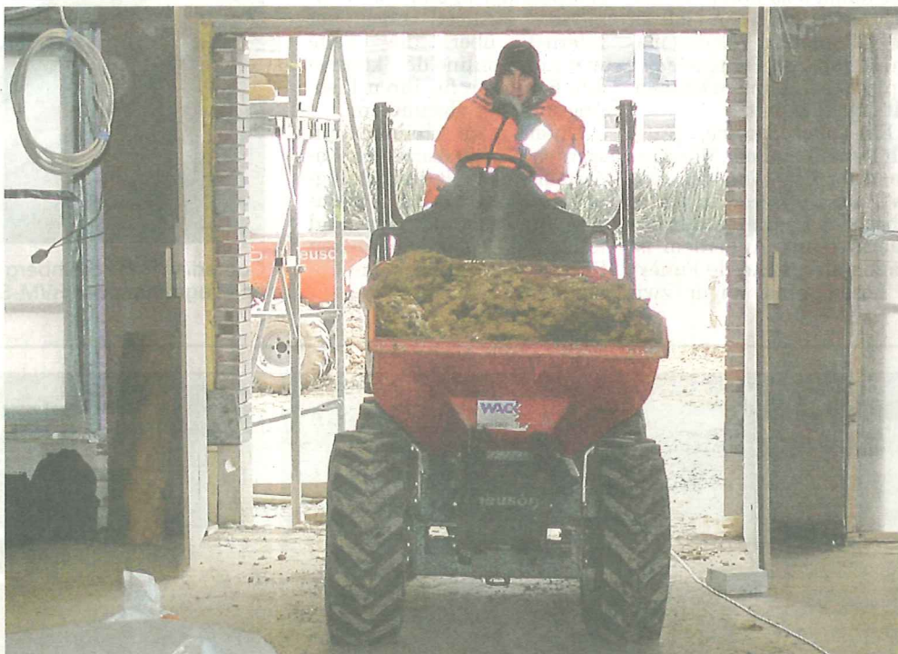
Das Abtransport von Schutt aus dem neu zu gestaltenden Garten im Innenhof muss durch das neue Gebäude erfolgen.