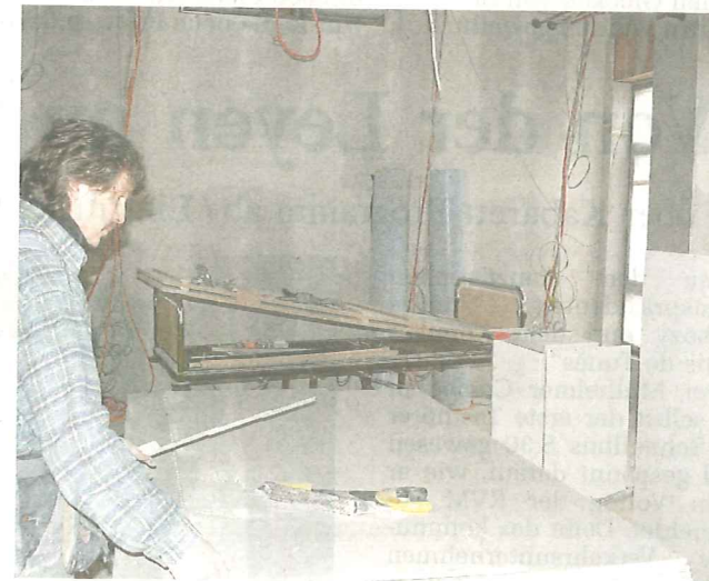
Die Trockenbauer arbeiten auf Hochtouren. Dutzende Handwerker sind im Einsatz.

Und für die wird es in jedem Fall kürzere Wege geben. Denn von der Intensivstation geht es im Notfall durch eine Schiebetür direkt in den OP.