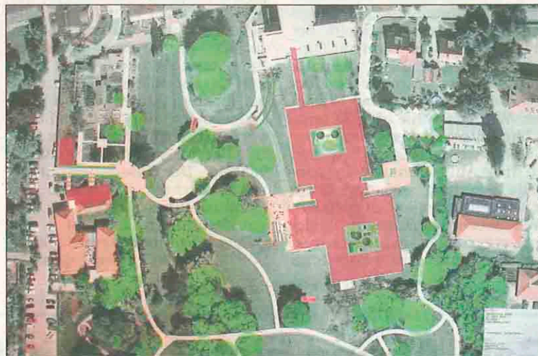
Das Reha-Zentrum am Sendenhorster St.-Josef-Stift wird aus zwei Gebäudeteilen bestehen, die hinter dem Parkflügel im Krankenhaus-Park errichtet werden.