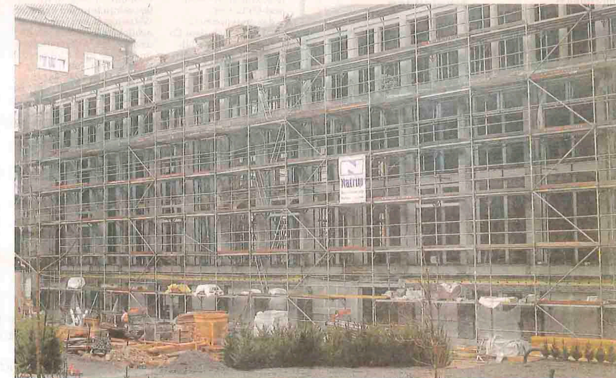
Der Rohbau im Innenhof des St.-Josef-Stifts ist fast fertig. Im kommenden Jahr soll er eingeweiht werden.